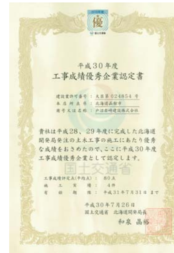
☆ 2018.07.26 北海道開発局より工事成績優秀企業認定書を受賞