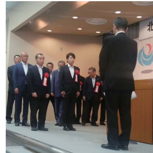
☆ 2017.07.25 北海道開発局長より優秀工事等表彰を受賞