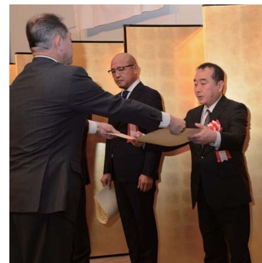
☆ 2018.12.18 北海道知事より森林土木工事部門で優秀工事等表彰を受賞